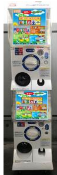
【ガチャ本体イメージ】