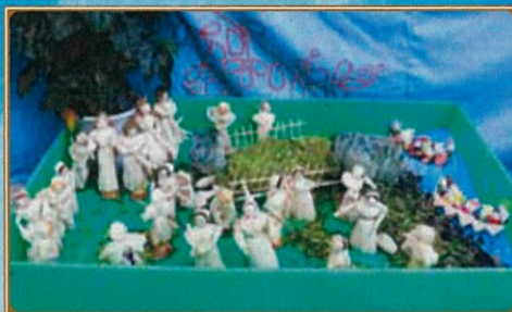
平成29年 町内作りもの(ダシ) 議長賞/美化デー