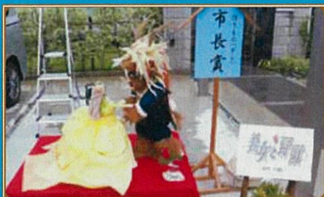
平成29年 町内作りもの(ダシ) 市長賞/美女と野獣