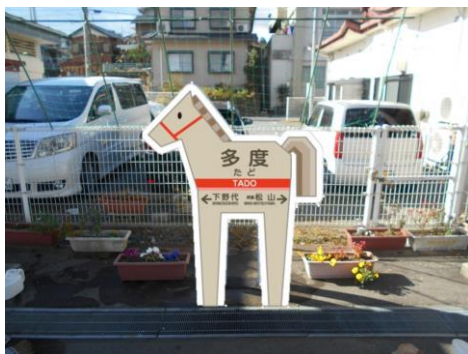
多度駅ご当地駅名標（イメージ）

沿線7市町に在住する小学校1年生を対象に、養老鉄道が乗り放題の年間無料パスを配布します。