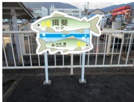
揖斐駅ご当地駅名標（イメージ）