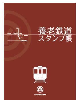
スタンプ帳（イメージ）