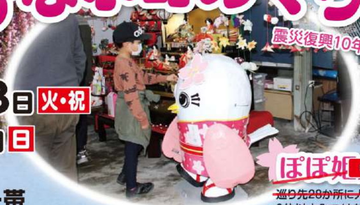
前回写真コンテスト 最優秀作品