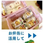
お弁当に活用して ▶▶