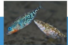
繁殖期のオス(左)とメス(右)