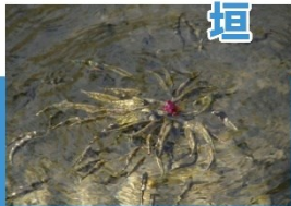
頭をすり合わせるハリヨ